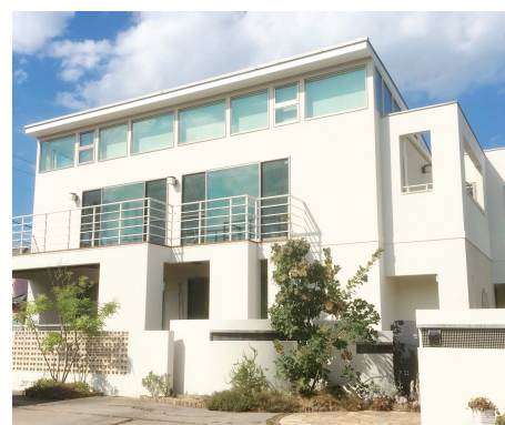
■医療法人 エム・ピー・エヌ 武田病院 HP http://takeda-h.byoinnavi.jp